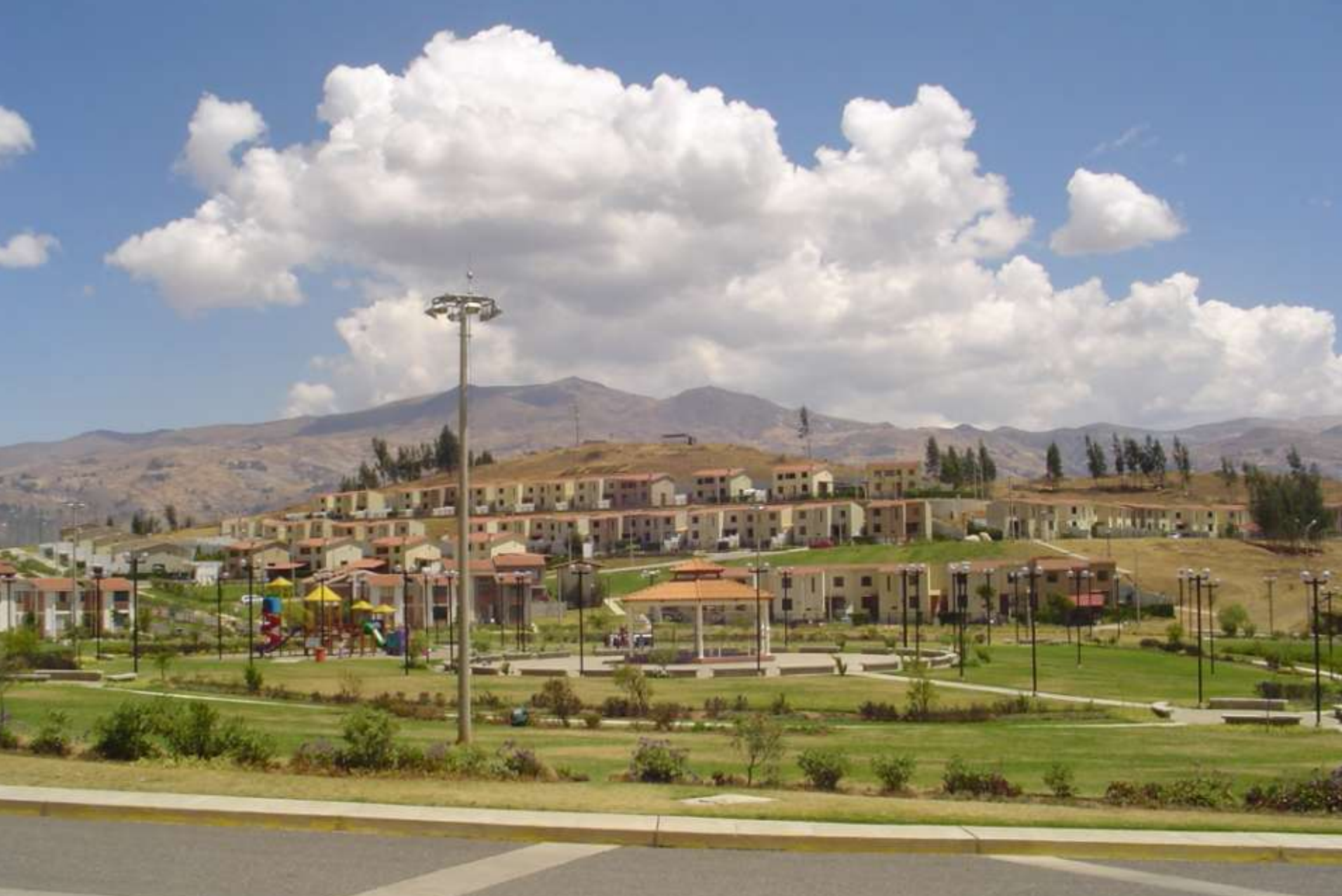
CIUDADELA EL PINAR – ANTAMINA (HUARÁZ)