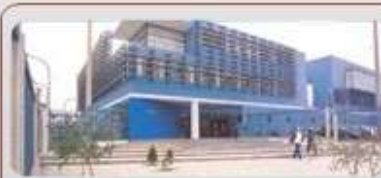
HOSPITALES Y CLÍNICAS