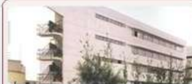
EDUCACIÓN Y CULTURA