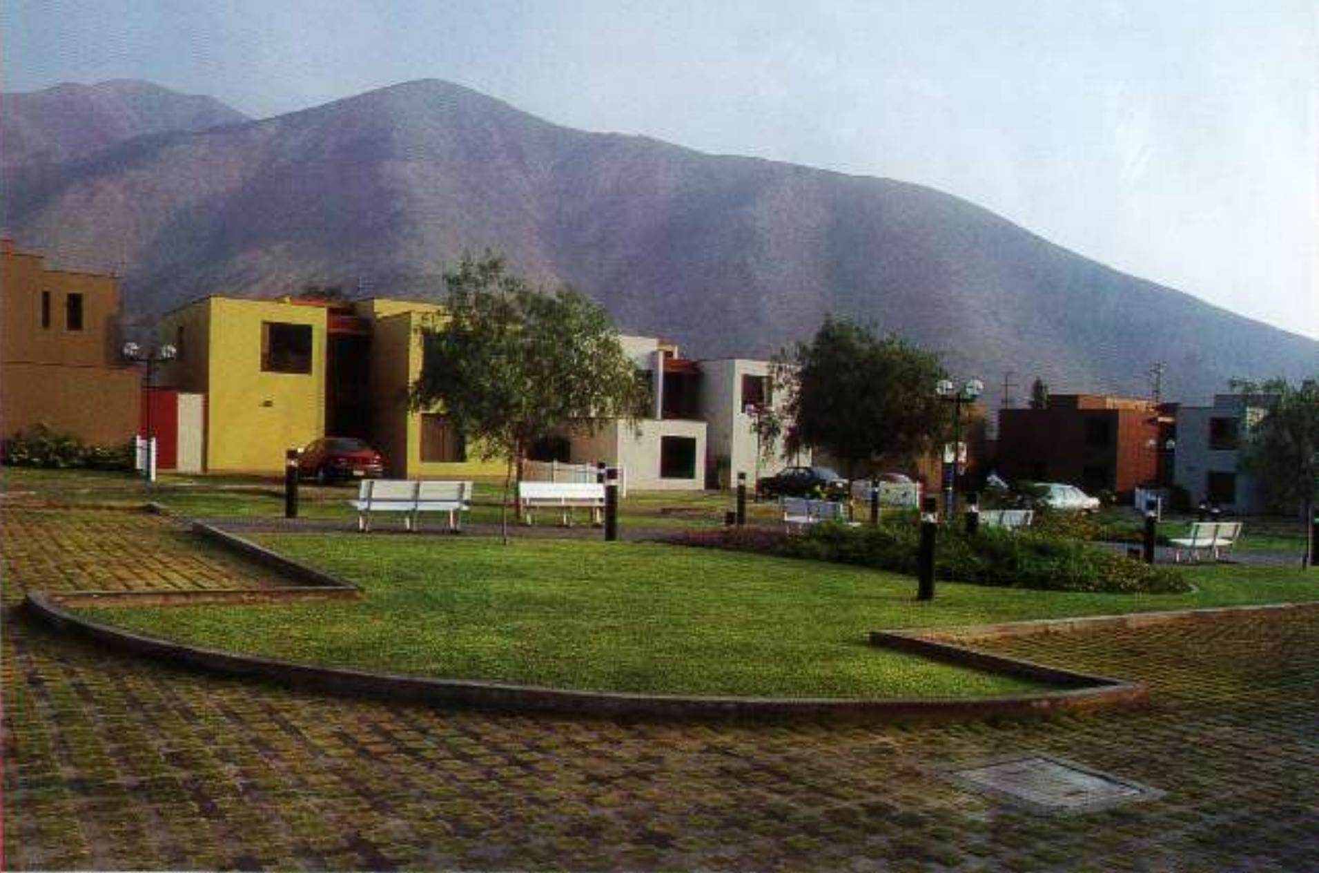
CONDOMINIO (LA MOLINA)